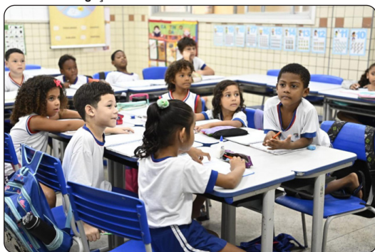
Estudantes da rede municipal de ensino

V itória conquistou o primeiro lugar ranking da alfabetização entre as capitais da região Sudeste e é a 4ª capital com maior taxa de crianças alfabetizadas até os 7 anos, de acordo com o 1º Relatório de Resultados do Indicador Criança Alfabetizada, do Ministério da Educação, que avaliou o nível de alfabetização de crianças entre 6 e 7 anos no Brasil em 2023.