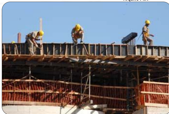
O setor da construção civil teve saldo positivo com a oferta de mais vagas de emprego na capital.