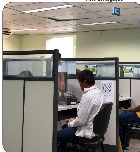
A capital representou 17,2% dos 44.815 novos postos de trabalho gerados no Estado em 2022.