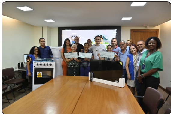
Mais três famílias da capital foram beneficiadas pelo Programa Casa Feliz e Segura.