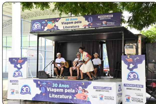
O caminhão da cultura estará na Escola Municipal de Ensino Fundamental (Emef) Eliane Rodrigues dos Santos nesta sexta-feira (10).

No sábado (11), a ação ocorre a partir das 9h30, na Rua Felicidade Corrêa dos Santos, próximo ao Museu Histórico da Ilha das Caieiras "Manoel Passos Lyrio", onde estará estacionado o caminhão. A Dourado Produções é quem realiza contações de histórias e a música será por conta do grupo de Chorinho, Corta Jaca.