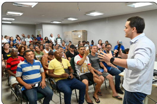
Moradores dos bairros São Pedro e Santos Reis participam de reunião sobre o programa Casa Feliz e Segura.

O Programa Casa Feliz e Segura, que leva segurança habitacional e dignidade para moradores de Vitória, estima atender a mais 70 famílias dos bairros Santos Reis e São Pedro, por meio de Melhorias Habitacionais e Reconstrução. Na noite desta terça-feira (23), a equipe da Secretaria de Desenvolvimento da Cidade e Habitação (Sedec) realizou uma ação informativa na Ilha das Caieiras, em Vitória, para apresentar o Programa às famílias. Esses locais estão programados para a etapa atual do programa, representando uma novidade para o Casa Feliz e Segura.