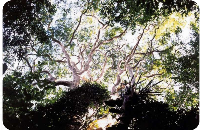
Mostra "As Lentes Revelam a Riqueza da Vida em Nossa Floresta" vai celebrar os 35 anos do Parque da Fonte Grande