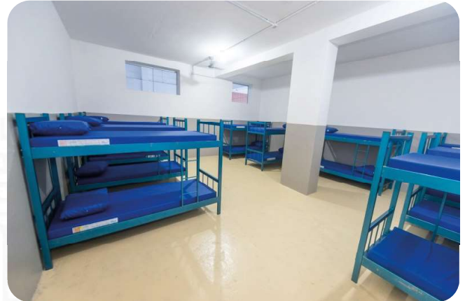
Ações voltadas para aprimoramento da rede socioassistencial de Vitória serão debatidas na Conferência Municipal