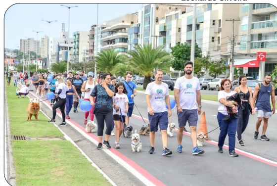
Cãominhada na orla de Camburi.

Mais de 150 animais com seus tutores enfeitando a orla de Camburi. A Cãominhada Vix proporcionou, na manhã do último domingo (9), muita informação, lazer entre tutores e animais, além da bênção para cada pet que esteve presente na orla de Camburi.