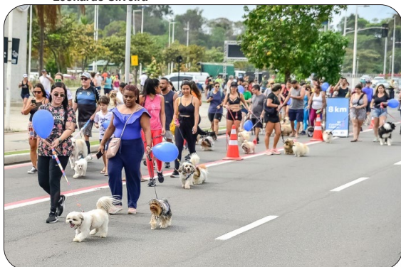
Cãominhada na orla de Camburi.