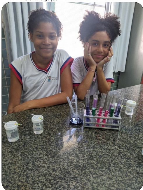
Estudantes participam do Programa de Iniciação Científica PIBIC Jr.