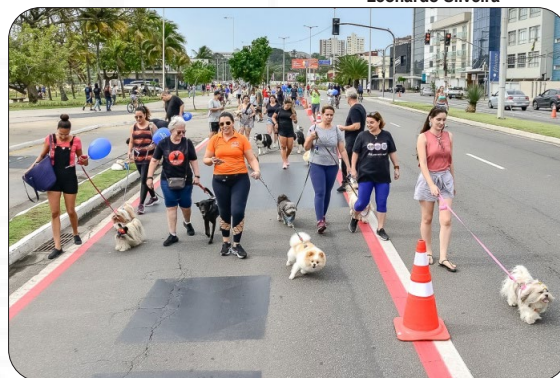
Cãominhada na orla de Camburi.

A Faculdade Multivix, por meio do curso de Medicina Veterinária, deu orientações sobre os cuidados com os Pets e também realizou checagem das carteiras de vacinação dos animais que participaram.