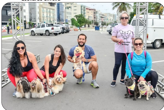
Cãominhada na orla de Camburi.