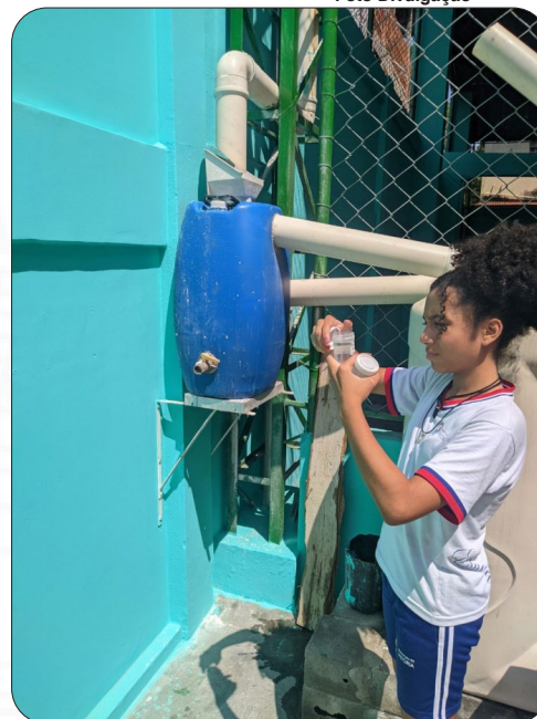
Estudantes participam do Programa de Iniciação Científica PIBIC Jr.

A Companhia de Desenvolvimento, Turismo e Inovação de Vitória (CDTIV), por meio do Fundo de Apoio à Ciência e Tecnologia (FACITEC) lançou, em agosto deste ano, bolsas de iniciação científica para Orientadores e Estudantes (Bolsistas Júnior), contemplando os 10 melhores projetos classificados no Edital nº 02/2022 do FACITEC.