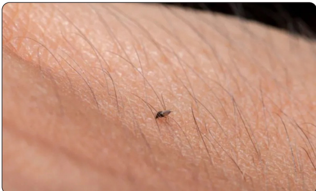
O maruim, pequeno inseto comumente encontrado em áreas próximas a manguezais e ambientes com matéria orgânica em decomposição, é o principal transmissor da febre do Oropouche

Desde o final de 2023, o Brasil vem registrando um aumento no número de casos da Febre do Oropouche, incluindo ocorrências fora da região Amazônica, área endêmica da doença.