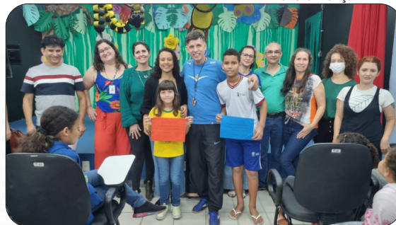
Leitores do Ano - Emef Alberto de Almeida