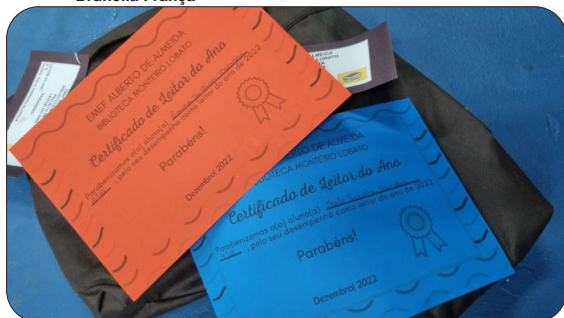
Leitores do Ano - Emef Alberto de Almeida