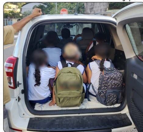
Crianças no porta-malas de carro que realizava transporte clandestino

"Verifique se o veículo está em boas condições, sinalizado, se o condutor possui o curso específico do Detran e a licença para transporte de passageiros e que tenha uma pessoa maior de 18 anos para acompanhar. Caso contrário, denuncie ao 156 ou ao 190 em caso de flagrante", destaca Charles De Marchi.