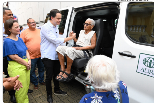
Veículo acessível que foi entregue durante a comemoração de 01 ano do Serviço de Atendimento em Domicílio (SAD), no Centro de Convivência da Terceira Idade do Centro Vitória

Para a celebração, o Centro de Convivência para pessoa idosa do Centro foi o cenário, organizado como um grande picadeiro circense, dando um clima especial à festa. O local ficou lotado com dezenas de idosos, pessoas com deficiência e adultos atendidos e acompanhados nos diferentes territórios pelos Centros de Convivência e Centros de Referência de Assistência Social (Cras), referência do SAD.