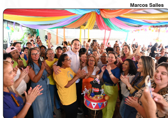
Centro de Convivência da Terceira Idade do Centro Vitória, comemoração de 01 ano do SAD - Serviço de Atendimento em Domicílio