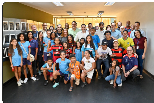
Prefeitura de Vitória lança Núcleo Esportivo da Semesp, na UniSales