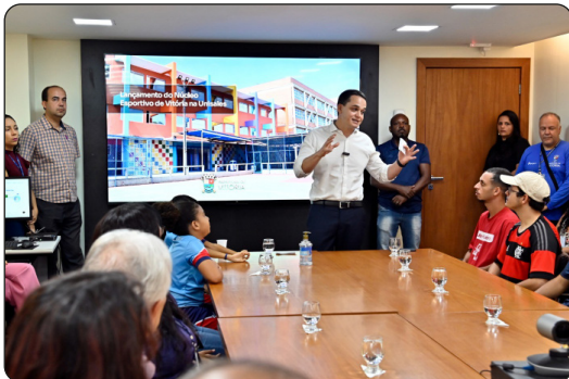
Lançamento do novo Núcleo Esportivo da Prefeitura de Vitória que funcionará nas dependências da Unisales

M ais esporte, saúde, lazer e bem estar! Com o objetivo de promover o acesso à prática de atividades esportivas e de lazer entre crianças e jovens, a Prefeitura de Vitória, por meio da Secretaria de Esportes e Lazer (Semesp), lançou nesta quinta-feira (02), o Núcleo Esportivo localizado na na UniSales, o maior do Espírito Santo. O novo centro disponibilizará 450 vagas em cinco modalidades esportivas diferentes.