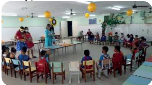
Atividades lúdicas marcam a Semana da Criança nas unidades de ensino de Vitória.