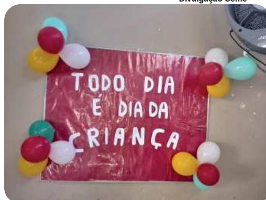
Atividades lúdicas marcam a Semana da Criança nas unidades de ensino de Vitória.

Corrida no saco, teatro, oficina de cavalinho, brincadeira com massinha. A Semana da Criança nas unidades de ensino de Vitória misturam o lúdico com a aprendizagem nas propostas de atividade, tanto na Educação Infantil quanto no Ensino Fundamental. Cada escola desenvolve suas ações, de acordo com os projetos pedagógicos da unidade de ensino.