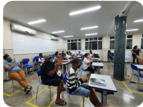
Aula sobre Mundo do Trabalho na EJA