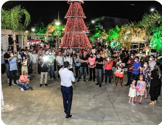
Lançamento do edital da 1ª fase do projeto Nova Orla da Grande São Pedro.