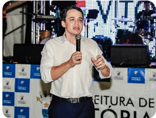
O prefeito Lorenzo Pazolini pontuou que essa é uma das obras mais aguardadas pelos moradores de Vitória há anos.

Um sonho para toda a comunidade da Grande São Pedro. A Prefeitura de Vitória lançou, na sexta-feira (14), o edital da 1ª fase do projeto "Nova Orla da Grande São Pedro". O evento foi realizado na Praça Dom João Batista, em São Pedro.