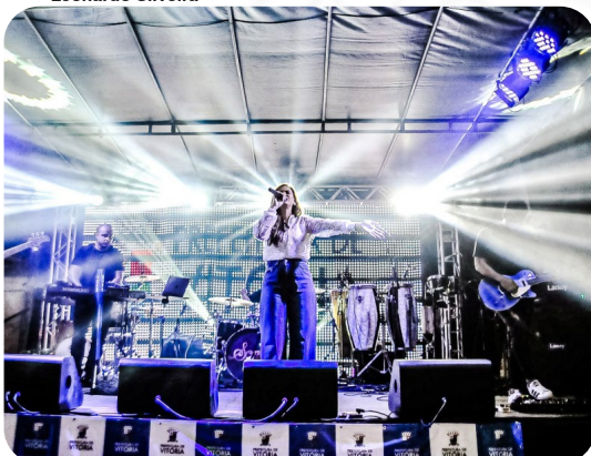
Lançamento do edital da 1ª fase do projeto Nova Orla da Grande São Pedro.