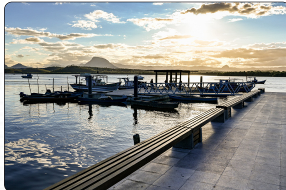
No domingo, a Missa da Ressurreição será celebrada no palco principal da festa, na Nova Orla de São Pedro

A partir da próxima quinta-feira (17), o recanto mais bucólico da capital, a Ilha das Caieiras, se transformará no epicentro de uma das celebrações mais tradicionais da Semana Santa no Espírito Santo. O Festival da Torta Capixaba 2025 promete encantar capixabas e turistas com uma imersão única na culinária, música e cultura local.