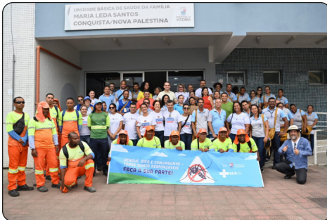
Ação de saúde na capital: mutirão de combate à dengue

A bril é o mês da saúde. Entre os dias 2 e 7 deste mês ocorre a Semana da Saúde no Brasil. Além disso, no próximo domingo (7), é celebrado o Dia Mundial da Saúde. Vitória é uma cidade que investe nos cuidados com os munícipes e, pensando nisso, para dar celeridade nos atendimentos de saúde, a PMV tem ampliando a oferta de consultas e exames especializados na capital, diminuindo o tempo de espera e garantindo mais qualidade de vida aos cidadãos.