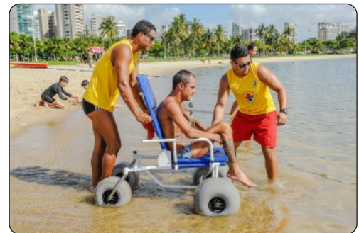
Ação de saúde na capital: projeto Praia Acessível garante acesso à praia e banho de mar às pessoas com deficiência e mobilidade reduzida.