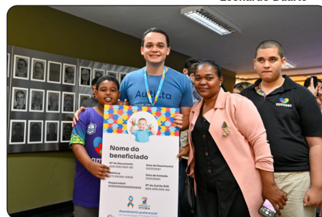
Entrega da Nova Carteira de Identificação da Pessoa com Transtorno do Espectro Autista (CIPTEA).

As mini-histórias são narrativas que dialogam com imagens capturadas das ações das crianças que revelam sobre suas experiências, seus pensamentos, seu modo de ser e estar no mundo que só são percebidas porque tem uma professora muito atenta, sensível, pesquisadora, que deseja saber mais sobre essa criança, que aposta nela, que acolhe suas singularidades e deseja tirá-la do anonimato.