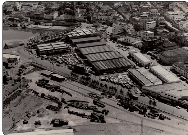
Vista da Vila Rubim e orla da baía de Vitória. No alto, a Santa Casa de Misericórdia

Todos os dias, milhares de pessoas chegam a Vitória pelo sul da ilha, atravessam a Avenida Elias Miguel e passam pelo Mercado da Vila Rubim sem perceber o legado de cultura e de tradições que ele representa. Funcionando há 97 anos, a história deste posto varejista e atacadista começa muito antes de sua inauguração; começa com a criação espontânea de um ponto de comércio próximo à foz dos rios Jucu e Santa Maria, em local perto do Centro.