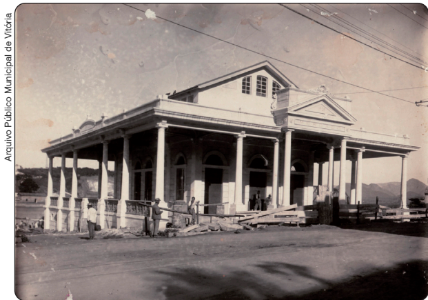
Fachada do Mercado da Vila Rubim em 1930

Publicada em 02/04/2026, às 15h55 | Atualizada em 02/04/2026, às 15h59 Por Eclamara Conti (econoti@vitoria.es.gov.br), com edição de Andreza Lopes