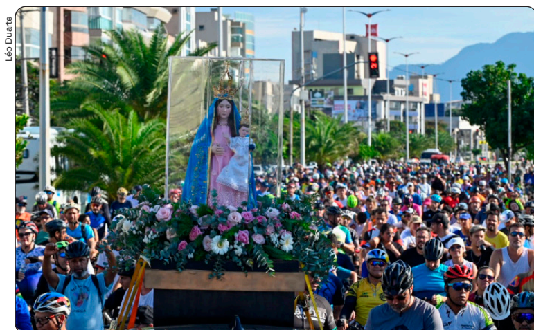
Romaria dos Ciclistas

Publicada em 01/04/2026, às 16h10 | Atualizada em 01/04/2026, às 16h16 Por Julya Feitosa (jfcavalho@vitoria.es.gov.br), com edição de Andreza Lopes