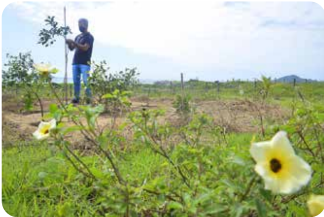
Plantio de árvores na restinga na Praia de Camburi