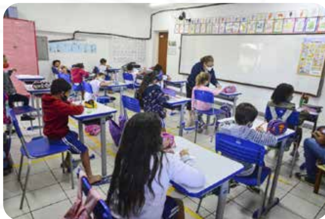
Sala de aula da EMEF Suzete Cuenet

Para 2022, serão dez unidades de ensino em tempo integral, sendo cinco Centros Municipais de Educação Infantil (Cmei) e cinco Escolas Municipais de Ensino Fundamental (Emef).