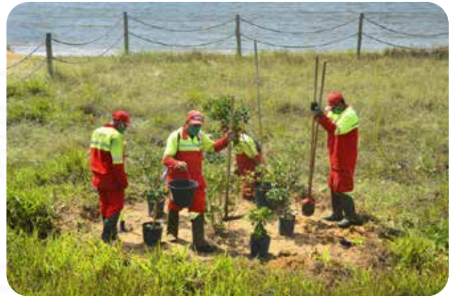
Plantio de árvores na restinga na Praia de Camburi

Quem frequenta a orla de Camburi ou circula pela Avenida Dante Michelini já percebe um novo cenário na praia, com as áreas de restinga cercadas, bem cuidadas e livres de espécies invasoras ou exóticas. Equipes da Secretaria Municipal de Meio Ambiente (Semmam) trabalham a todo vapor na recuperação da vegetação costeira, fazendo o plantio de aproximadamente 150 mudas por dia, na etapa final do projeto, entre a avenida Adalberto Simão Nader e o final da praia de Jardim Camburi.