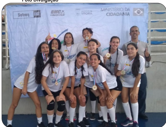
Campeãs de Dama feminino sub-15.