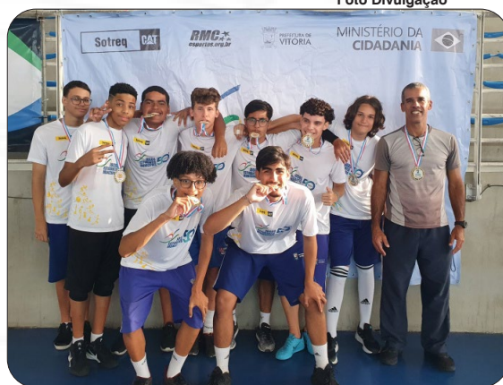
Campeã do vôlei masculino sub-15.

Muitas finais emocionantes marcaram os Jogos Escolares Municipais de Vitória (Jemvi) nos últimos dias. E o número de escolas campeãs está crescendo, a disputa pelo título de campeã geral da 50ª edição segue acirrada!