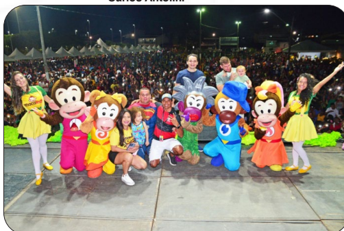
Festa das Crianças na Grande Goiabeiras.