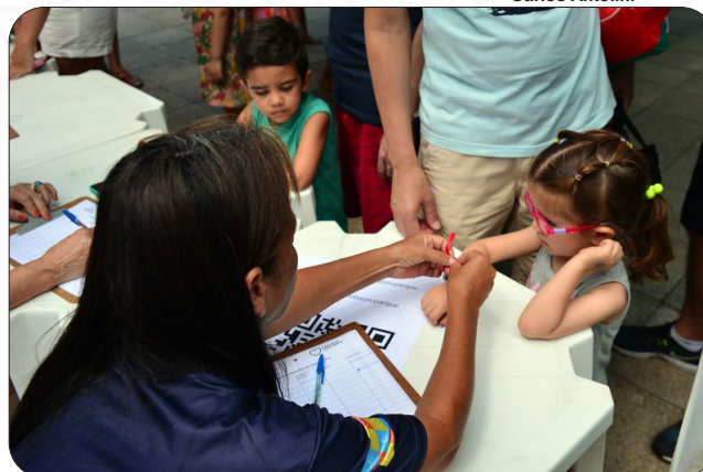
Festa das crianças no Parque Manolo Cabral.