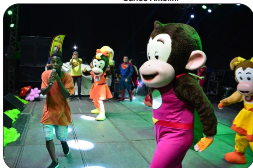
Festa das Crianças na Grande Goiabeiras.