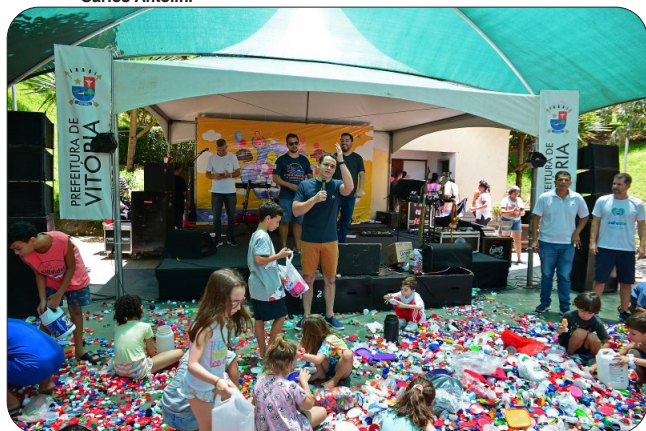
Festa das crianças no Parque Manolo Cabral.