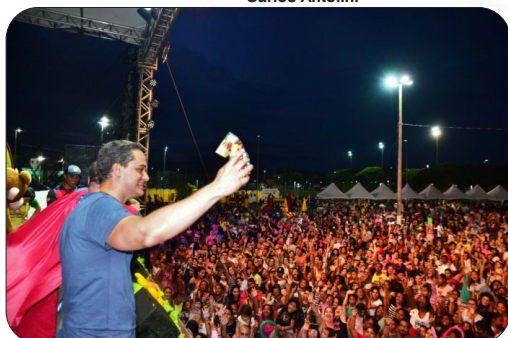
Festa das Crianças na Grande Goiabeiras.