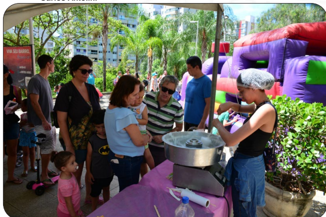
Festa das crianças no Parque Manolo Cabral.