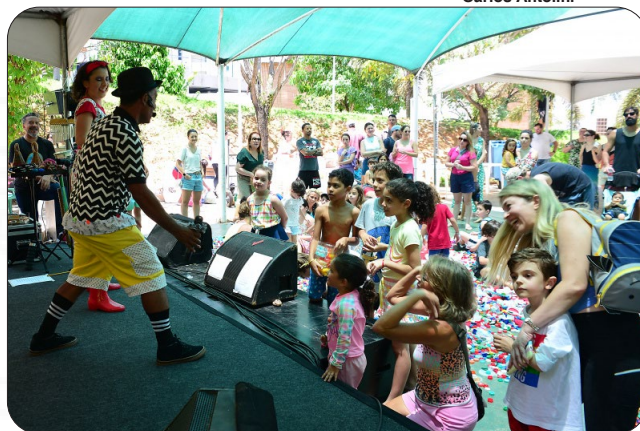
Festa das crianças no Parque Manolo Cabral.

Festa com pipoca, algodão doce, pula pula, castelão, gincana da tampinha, muita música e banho de mangueira! Muitas famílias estiveram no Parque Pianista Manolo Cabral, na manhã deste sábado (29), aproveitando uma manhã colorida e de muita diversão. A "Festa do Dia das Crianças", promovida pela Associação de moradores do Barro Vermelho e Santa Luíza", alegou a criança.