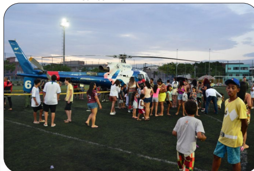
Festa das Crianças na Grande Goiabeiras.