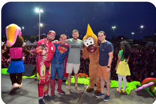
Festa das Crianças na Grande Goiabeiras.