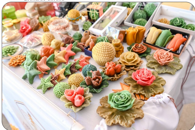
Feira de Mulheres Empreendedoras na Casa do Cidadão.