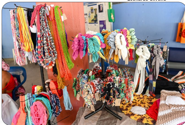
Feira de Mulheres Empreendedoras na Casa do Cidadão.

A Feira de Mulheres Empreendedoras, realizada todos os meses na Casa do Cidadão, está crescendo, atraindo a participação de novos negócios. Na edição deste mês, que acontece nesta quarta (5) e quinta-feira (6), o número de participantes vai saltar de 20 para 35 expositoras, que vão levar uma maior variedade de produtos artesanais, alimentos, vestuário, acessórios, decoração, perfumaria e estética para o "varandão". A feira acontece das 9h às 17h e é aberta ao público.