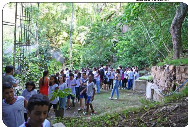
Estudantes aprendem sobre Mata Atlântica no Parque Natural Gruta da Onça.

A atividade faz parte das ações ofertadas pela Semmam, tanto para os moradores da capital quanto para os demais munícipes da Grande Vitória e até mesmo de fora dela, por meio de agendamentos junto aos Centros de Educação Ambiental (CEAs) espalhados pela cidade, que possibilitam o desenvolvimento de projetos de educação ambiental, como o projeto "Mata Atlântica: Floresta que ensina".