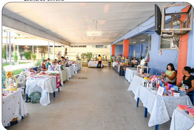
Feira de Mulheres Empreendedoras na Casa do Cidadão.