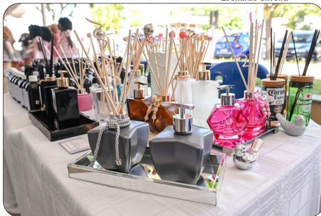
Feira de Mulheres Empreendedoras na Casa do Cidadão.