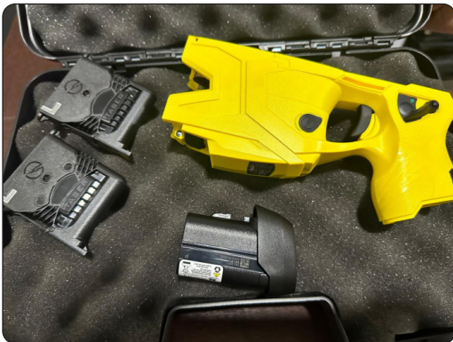
Armas de choque compradas para a Guarda de Vitória

Vitória deu mais um passo para aprimorar os equipamentos da Guarda Civil Municipal (GCMV), visando garantir ainda mais segurança aos cidadãos. O efetivo da corporação, agora, conta com 250 novas armas de choque vindas dos Estados Unidos: as taser.