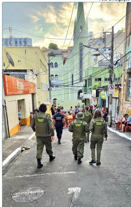
Os fiscais e guardas percorreram vários pontos do Centro de Vitória