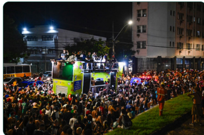
Circuito da folia