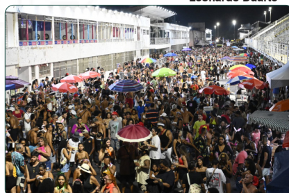
Multidão no Sambão do Povo