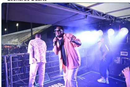
Netinho de Paula