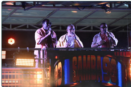
Samba 90 Graus fecha noite no Sambão