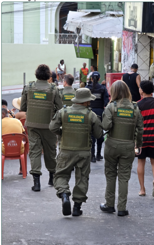
A fiscalização vai continuar durante todos os dias de Carnaval

De acordo com o Código Municipal de Meio Ambiente -- Lei Municipal nº 4.438/1997, Decreto Municipal nº 10.023/1997 e nº 17.304/2018 --, é terminantemente proibida, em qualquer período do ano, a presença de veículos automotores e caixas de som portáteis em espaços públicos de Vitória, incluindo praias, praças, parques, calçadões e ruas. As multas são enquadradas como infração grave, e o valor pode variar entre R$ 5.447,10 e R$ 9.743,75.