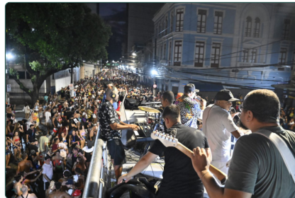
Som e Cia puxa trio no Circuito da Folia

Quem aproveitou o último dia do desfile dos blocos do Carnaval no Centro, teve ainda a oportunidade de curtir atrás do trio até o Sambão do Povo: é o Circuito da Folia, que arrastou uma multidão no último dia da programação de Carnaval de Vitória.