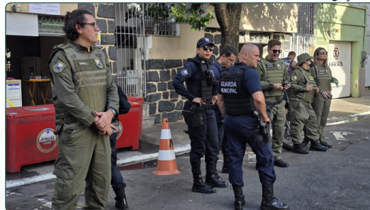
Ação conjunta entre Guarda de Vitória e Secretaria de Meio Ambiente

Uma operação entre a Secretaria de Meio Ambiente e a Guarda Civil Municipal de Vitória apreendeu 36 caixas de som na noite deste sábado (1º), durante o Carnaval no Centro de Vitória. Cinco carros de som também foram autuados.