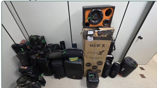
Ao todo, 36 caixas de som foram apreendidas