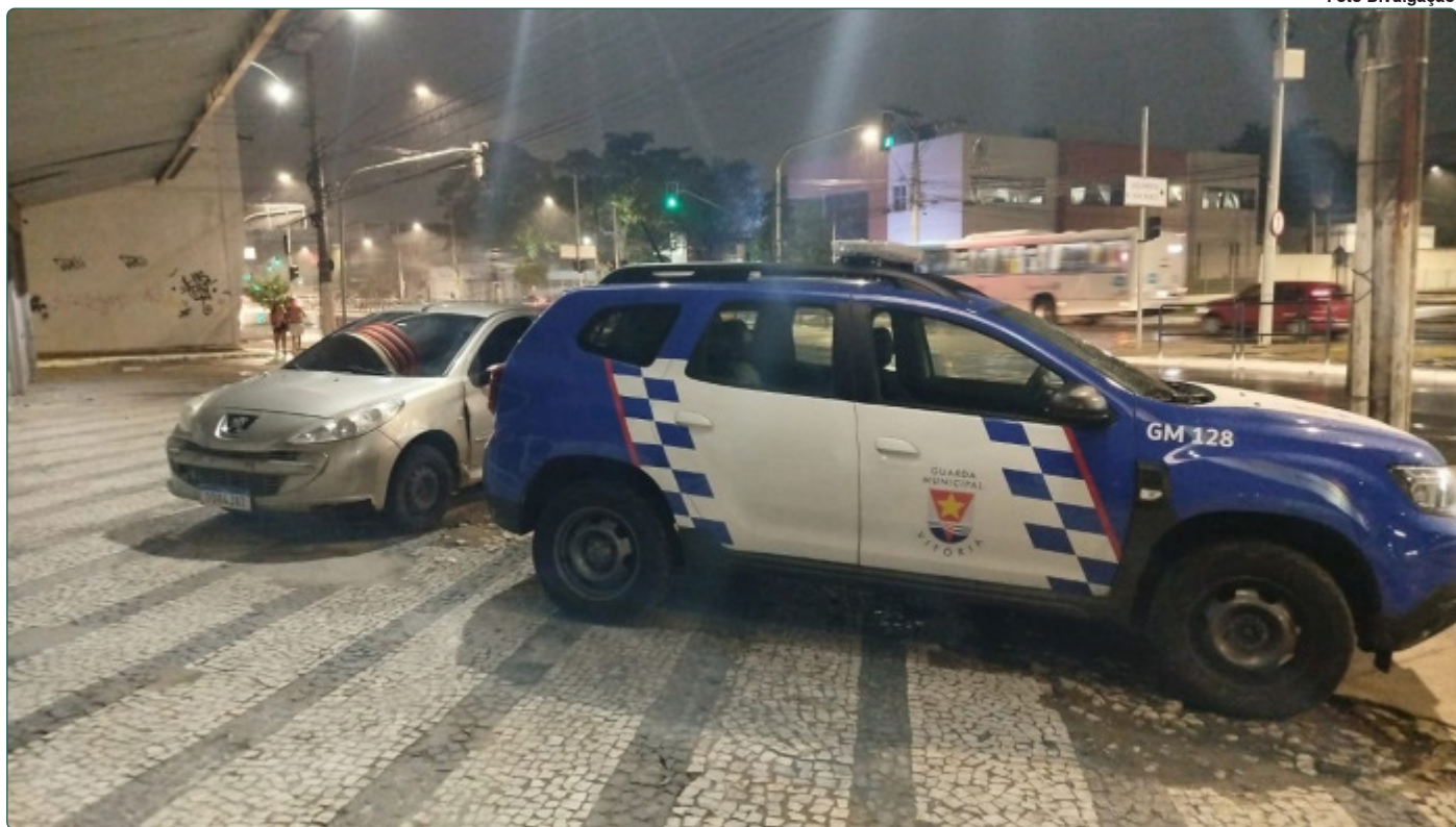
Guarda recupera carro roubado em assalto nesta segunda-feira (3)

Publicada em 04/03/2025, às 15h15 Por José Carlos Schaeffer (jcschaeffer@vitoria.es.gov.br), com edição de José Carlos Schaeffer