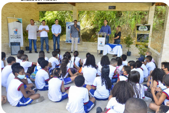
Estudantes participam de ações educativas no Parque Natural Municipal Vale do Mulembá.