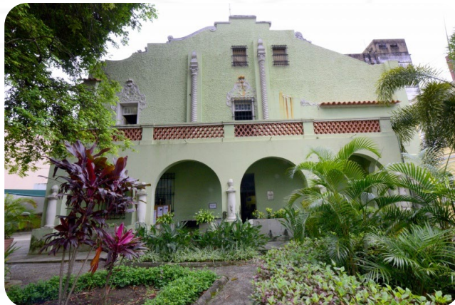
Biblioteca Municipal Adelpho Poli Monjardim.