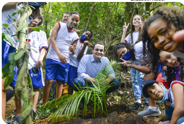
Estudantes participam de ações educativas no Parque Natural Municipal Vale do Mulembá.

Estudantes da Escola Municipal de Ensino Fundamental (Emef) Ceciliano Abel de Almeida, que fica em Itararé, tiveram uma programação diferente nesta segunda-feira (21 de março), Dia Municipal de Preservação e Recuperação de Nascentes. Eles participaram de ações educativas no Parque Natural Municipal Vale do Mulembá, durante a abertura da Semana da Água 2022, que tem como tema "Das nascentes à nossa casa: tornando visível a água invisível". A ação teve a presença do prefeito Lorenzo Pazolini e do secretário de Meio Ambiente de Vitória, Tarcísio Foeger.