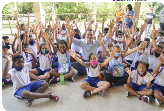
Estudantes participam de ações educativas no Parque Natural Municipal Vale do Mulembá.

"Muito feliz em ver esses jovens tão atentos e participativos. Um dia importante, que reforça como a água é um recurso natural essencial para a manutenção da vida humana e do meio ambiente, além de ser responsável por inúmeras outras coisas no planeta. Foi uma manhã muito especial. Continuaremos sempre cuidando do meio ambiente e da vida dos nossos moradores", disse o Prefeito Lorenzo Pazolini.