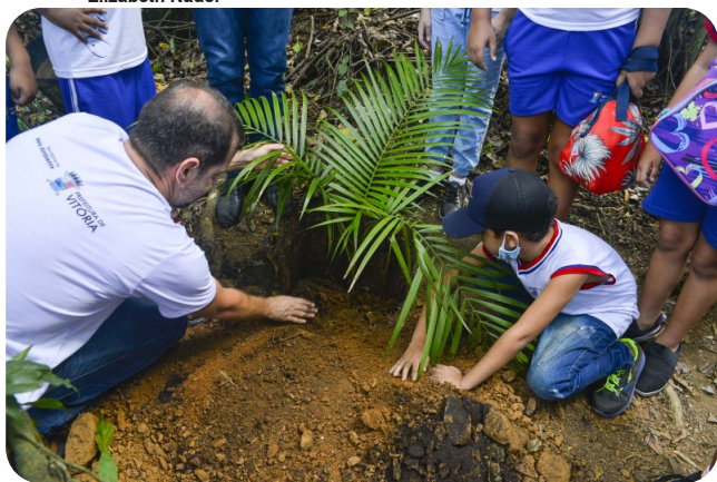
Estudantes participam de ações educativas no Parque Natural Municipal Vale do Mulembá.