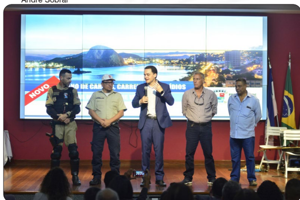
PL Guarda Civil Municipal