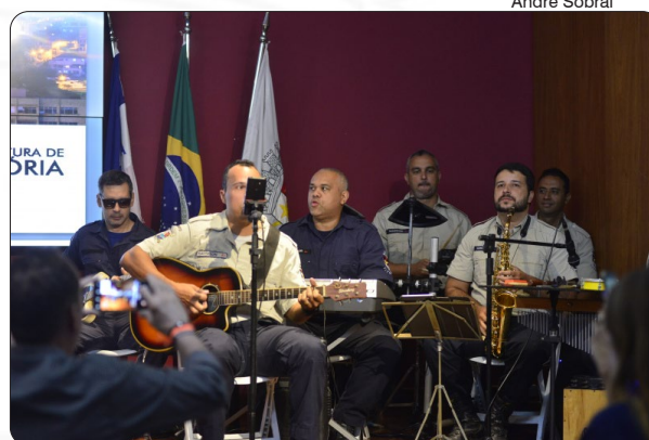
PL Guarda Civil Municipal

Os agentes da Guarda Civil Municipal de Vitória (GCMV) terão novo plano de cargos, carreira e subsídio. Na tarde desta terça-feira (07), o Prefeito da Capital, Lorenzo Pazolini, enviou à Câmara Municipal de Vereadores (CMV) o Projeto de Lei que estabelece as novas diretrizes para a categoria, com aumento médio de 37%. A solenidade aconteceu no auditório da Prefeitura de Vitória.