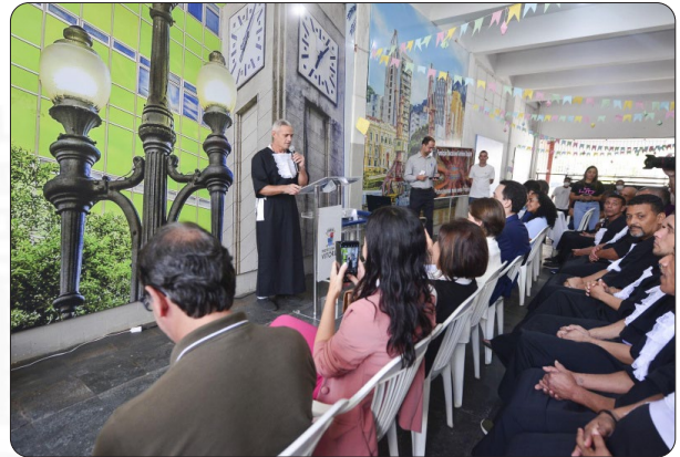
Formatura do curso de Garçom FEAD

Trze pessoas usuárias do Abrigo Emergencial Transitório para Adultos e Famílias, equipamento municipal vinculado à Secretaria de Assistência Social (Semas), receberam nesta terça-feira (7) o certificado de conclusão do curso de garçom.