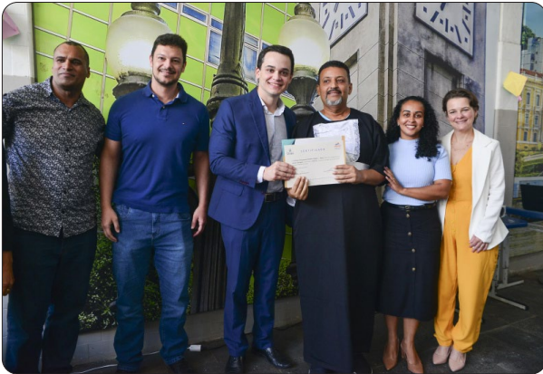
Formatura do curso de Garçom FEAD